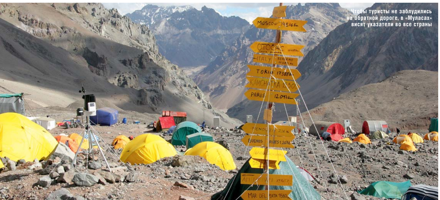
Чтобы туристы не заблудились на обратной дороге, в «Муласах» висят указатели во все страны