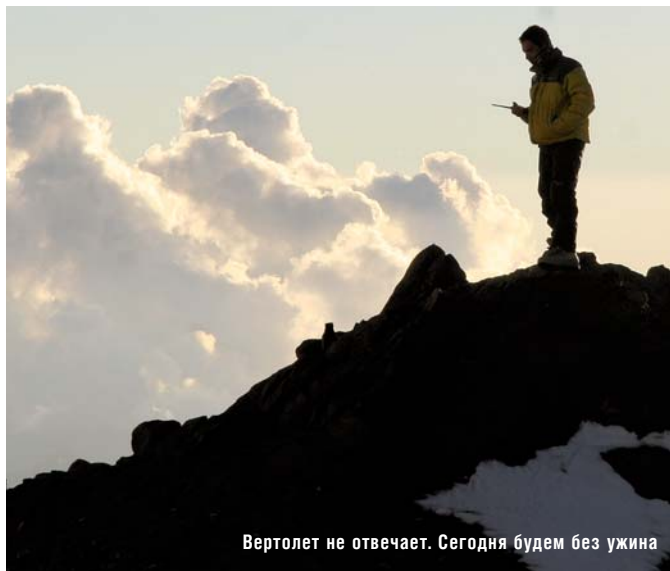
Вертолет не отвечает. Сегодня будем без ужина

Следующей недели лучше бы не было. Муласы — лагерь Канада 4900 — Муласы — лагерь Не Помню Как Называется 5500 — Муласы — Канада — (вспомнил!) Кондорес — Муласы — Кондорес — лагерь Берлин 5900 — Муласы. Иногда удавалось поспать. Реже поесть. В двух километрах от Муласов, на высоте 4500, была обнаружена секретная гостиница с рестораном! На столе была даже (!) стеклянная посуда. И (гусары — внимание!) официантки!