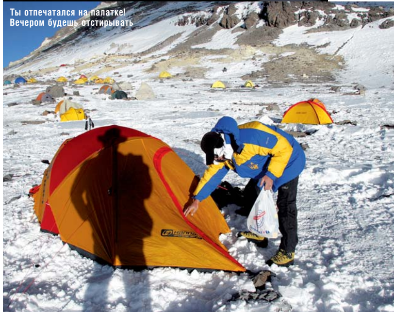
Ты отпечатался на палатке! Вечером будешь отстирывать