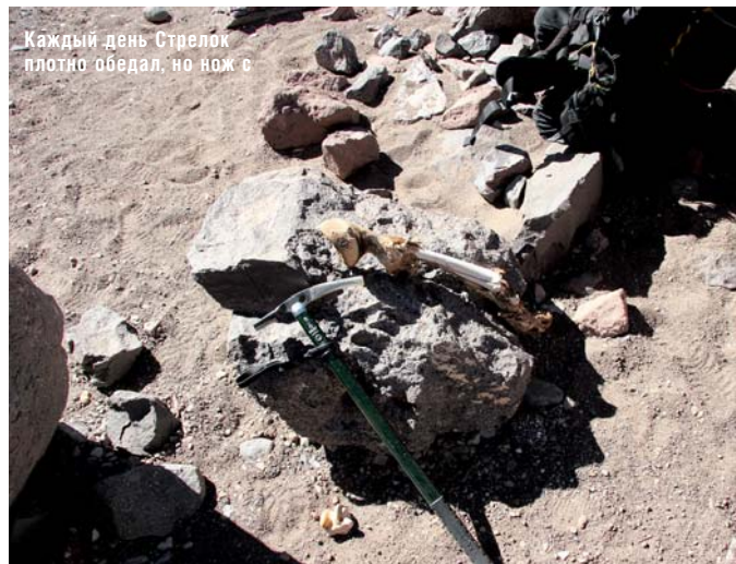
Каждый день Стрелок плотно обедал, но нож с