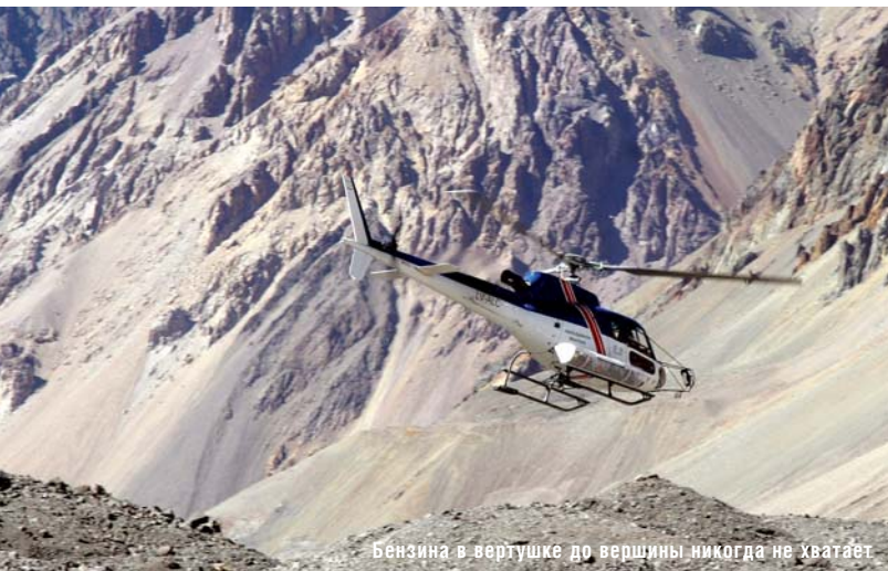
Бензина в вертушке до вершины никогда не хватает