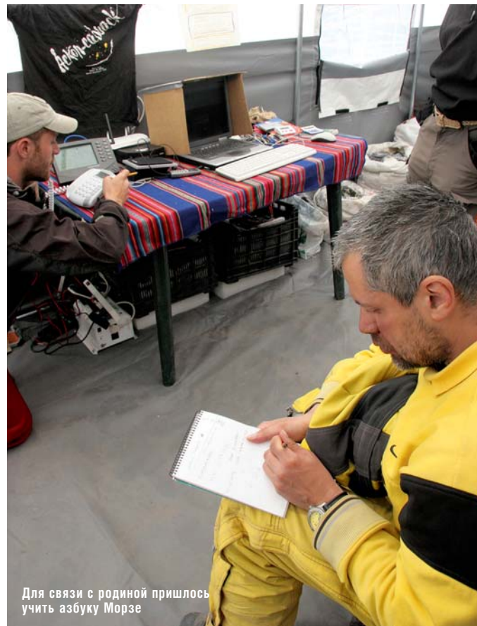
Для связи с родной пришлось учить азбуку Морзе

На вершине бразилец расплакался, достал шелковый платочек-тряпочку с вышитым именем своей девушки и нарисованным сердцем. Я сфотографировал его пару раз мьльницей и выслушал сентиментальную речь о том, что он здесь только благодаря мне. Мы поднялись крайними в тот день. Но по-