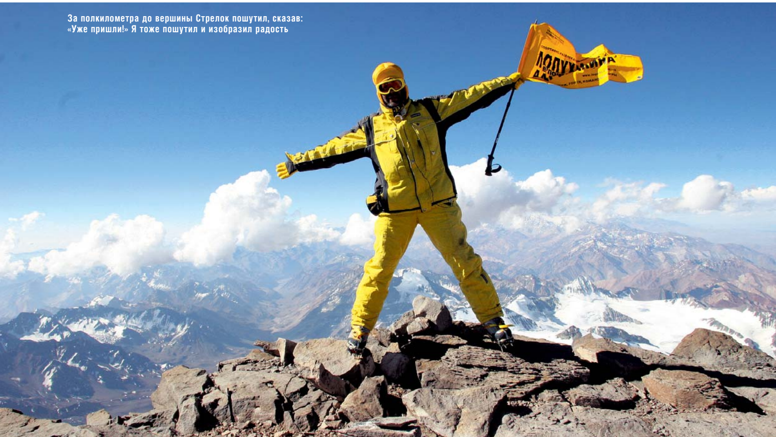
За полкилометра до вершины Стрелок пошутил, сказав: «Уже пришли!» Я тоже пошутил и изобразил радость