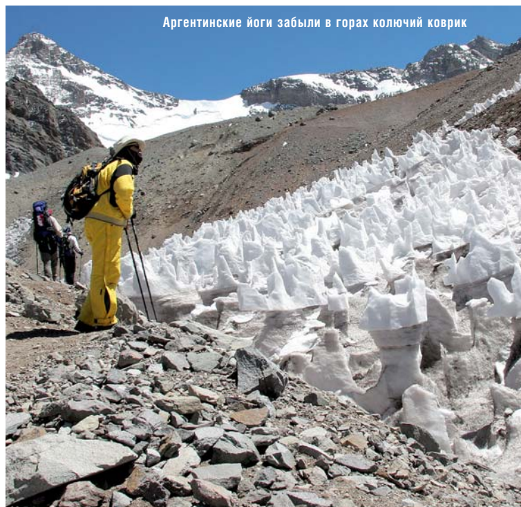
Аргентинские йоги забыли в горах колючий коврик

Муласы, как сокращенно называют базовый лагерь,