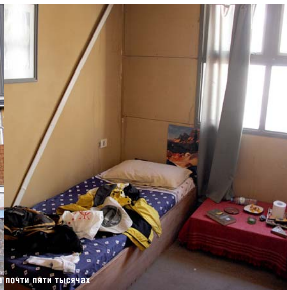
Почти пять звезд на почти пяти тысячах