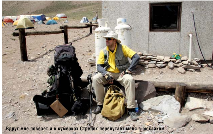
Вдруг мне повезет и в сумерках Стрелок перепутает меня с рюкзаком

Завтра предстоял двадцатикилометровый переход в базовый лагерь «Пласа дель Мулас», на 4300. Я грустно смотрел в карту, отмеряя расстояние оттопыренными мизинцем и указательным пальцем, и понимал, что сдохну примерно в районе безымянного пальца, где меня и закопают. Единственным шансом выжить завтра было соблазнить одного из мулов (результат секса лошади и ослика — тупиковая ветка эволюции,