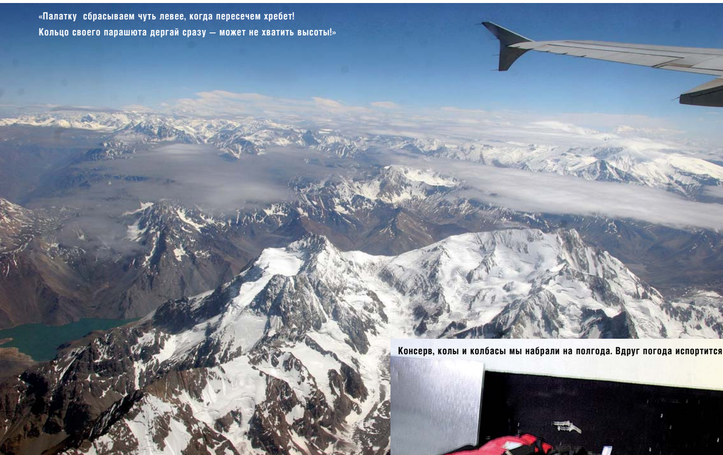
Консерв, колы и колбасы мы набрали на полгода. Вдруг погода испортится

«Палатку сбрасываем чуть левее, когда пересечем хребет! Кольцо своего парашюта дергай сразу — может не хватить высоты!»