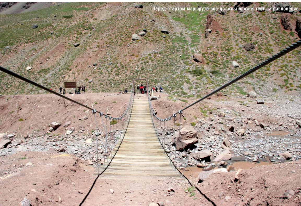
Перед стартом маршрута все должны пройти тест на равновесие

редями на регистрацию рейсов. С очередями мы расправились быстро, толкая перед собой огромный тюк со снарягой. С регистрацией и перевесом чуть медленней: пришлось найти в очереди еще троих добровольцев и на них расписать свой перевес. Долбаный перелет был