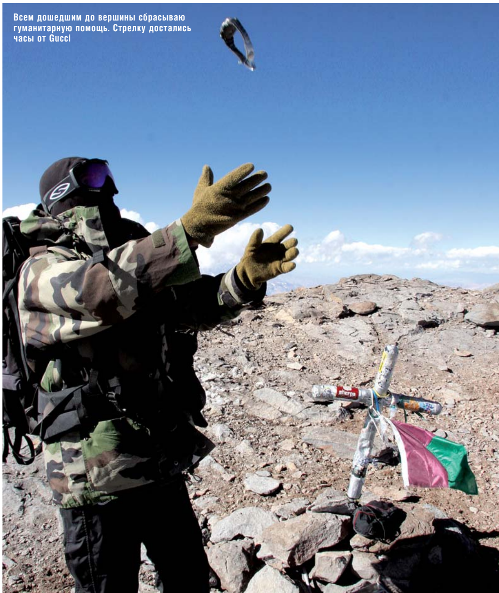
Всем дошедшим до вершины сбрасываю гуманитарную помощь. Стрелку достались часы от Gissì

За 300 метров до вершины есть чудная площадка — Конолетта, где все принимают последний глоток чая, последнюю шоколадку, последнюю витаминку, взятую на вершину. «Ой-ой, у меня заложил ухо. Надо спускаться.» «Ой-ой, что-то кольнуло в бок. Я разворачиваюсь!» Европейские ушлепы слишком правильны и могут пожертвовать парой месяцев подготовок и неделями жизни на горе, развернувшись в месте, от которого до вершины всего три часа. Я чувствовал себя ужасно, но от перехода на «полный привод» все еще удерживался. Разворачиваться — не наш метод.