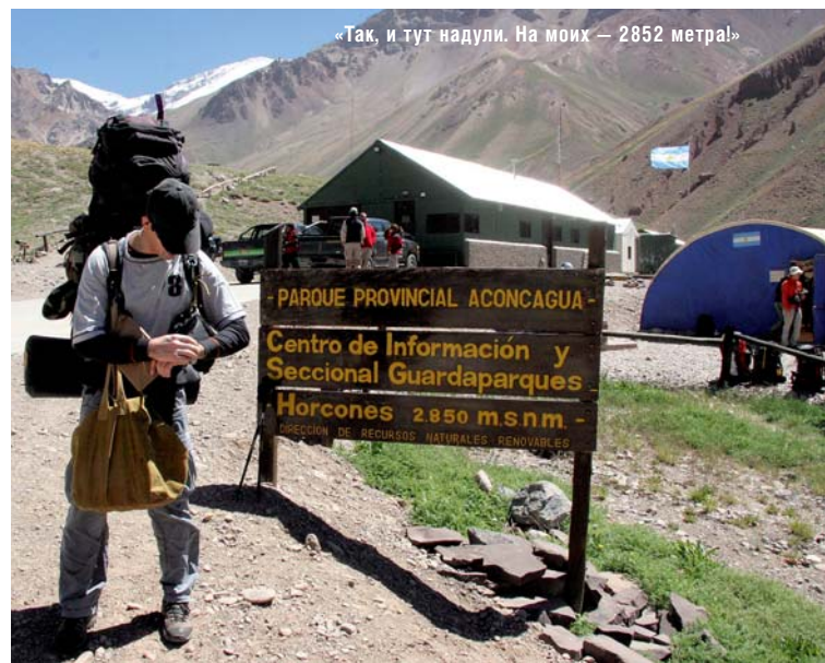
«Так, и тут надули. На моих — 2852 метра!»

28 декабря (как и 26 апреля в этом году) начинаются пару дней освобождения Украины, которые сопровождаются пробками на бориспольской трассе и торчащими из здания аэропорта оче-