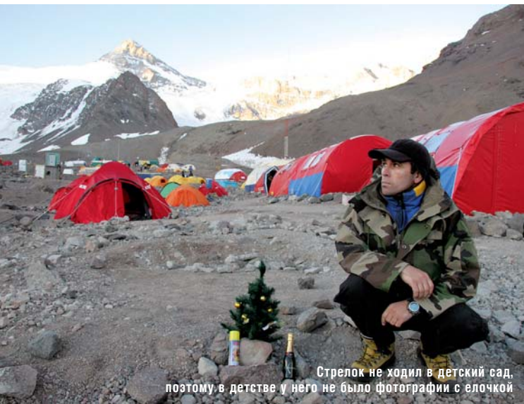
Стрелок не ходил в детский сад, поэтому в детстве у него не было фотографии с елочкой